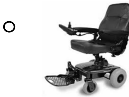
FAUTEUIL DE TYPE «JAZZY» *** (SUR UN CYLINDRE)