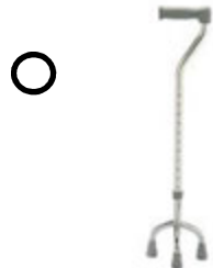
CANNE TRIPODE OU QUADRIPODE