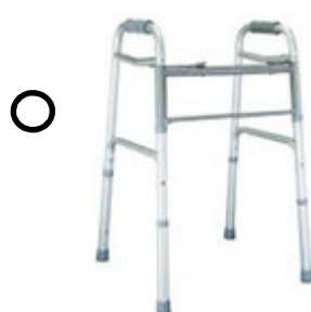
MARCHETTE NON PLIANTE