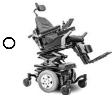
FAUTEUIL MOTORISÉ (BASCULE)