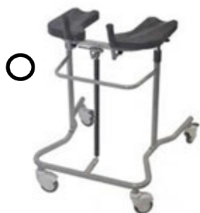
TRÈS GRANDE MARCHETTE