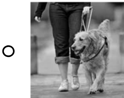
CHIEN (GUIDE OU ASSISTANCE)